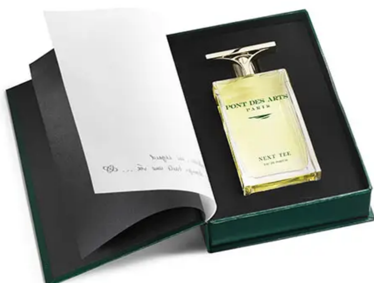
Coffret flacon 100 ml © Pont des Arts

NEXT TEE de la marque Pont des Arts est un parfums d'auteur réalisée dans la haute tradition de la parfumerie française. Également passionnés de golf, les fondateurs, entouré de deux parfumeurs de renommée internationale, Bertrand Duchaufour et Vincent Grandjon, offrent ici un très beau vétiver aux notes fraîches. Next Tee est mixte, créée en France avec des partenaires d'artisans d'Arts ou entreprise du patrimoine vivant.