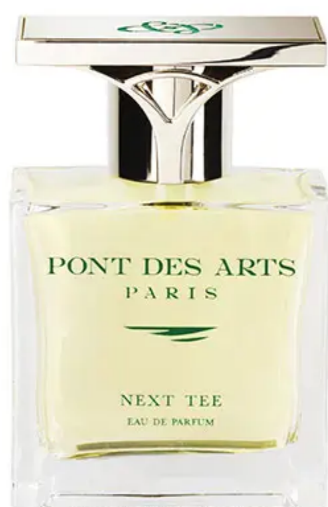
Flacon 50 ml © Pont des Arts

Les fondateurs sont également passionnés de golf et ont lancé une collection de parfums « sport » appelée « NEXT TEE » en 2019, avec des notes fraîches de bergamote, de cédrat, de pamplemousse, de mandarine verte et de lavande. Ainsi que des notes poivrées de baie rose, de genièvre, de vétiver, de maté absolu, de cèdre de Virginie et de musc. Next Tee est un parfum mixte.